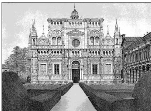
Pavia - La Certosa